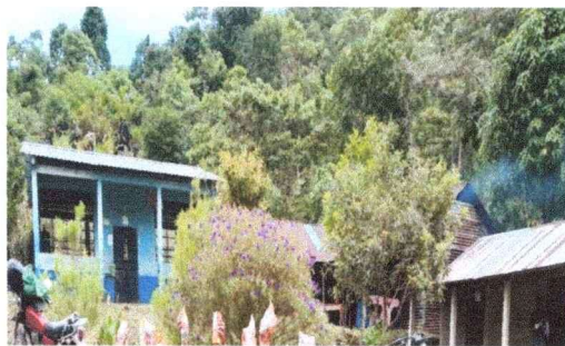
Foto 4. Módulo 4: Cambio de láminas acanaladas láminas a troqueladas. Sustitución de vidrios de ventanas, pintadas interior y exterior.