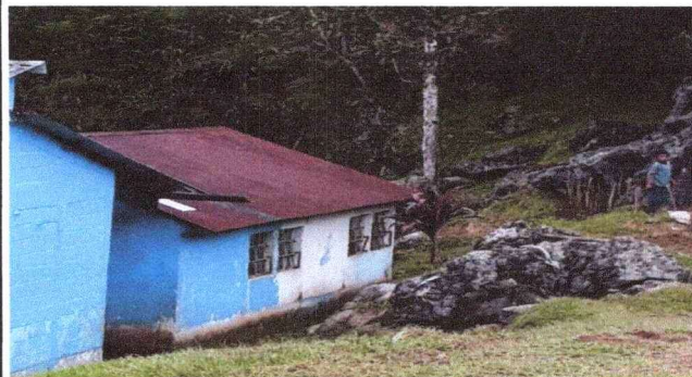
Foto 2: Cambio de piso de torta de cemento a torta de cemento, pintadas de interior y exterior, cambio de estructura de madera a metal, láminas acanaladas a troqueladas.