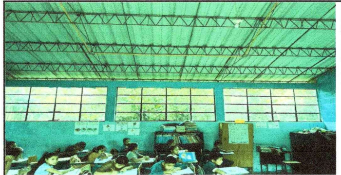
Foto 4. Módulo 4: Sustitución de estructura metálica a costaneras, láminas troqueladas a troqueladas. Sustitución de vidrios de ventanas, pintada de pared interior y exterior.