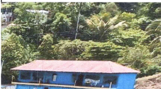
Foto 5: Módulo 5: Sustitución de láminas acanaladas láminas a troqueladas. Rehabilitación de balcones, pintadas de paredes interior y exterior.