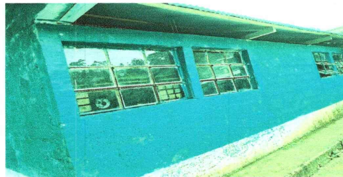
Foto 5: Módulo 5: Sustitución de estructura de madera a costanera, láminas acanaladas láminas a troqueladas. Rehabilitación de balcones, pintada de pared interior y exterior.