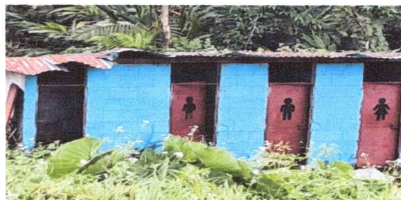
Foto 6: Sustitución de láminas acanaladas láminas a troqueladas. Sustitución de puertas de metal, pintadas interior y exterior.

Observación: Si es necesario se pueden agregar hojas adicionales y actualizar el número de hojas.