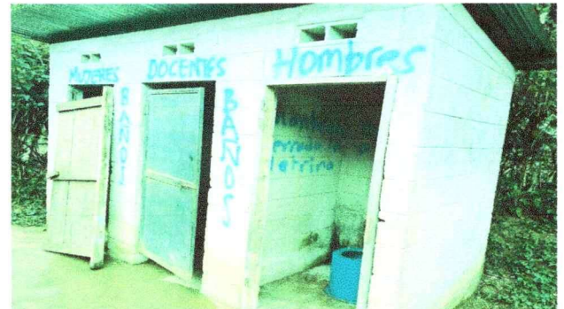
Foto 6: Sustitución de láminas acanaladas láminas a troqueladas y estructura portante. Sustitución de puertas a puerta de metal, pintada de pared interior y exterior.

Observación: Si es necesario se pueden agregar hojas adicionales y actualizar el número de hojas.