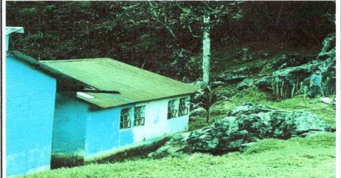
Foto 2: Sustitución de estructura de madera a costanera, láminas acanaladas a troqueladas. Pintada paredes de Interior y Exterior, Sustitución de piso de torta de cemento a torta de cemento.