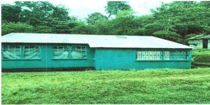
Foto 3 Módulo 3: Sustitución de láminas acanaladas a láminas a troqueladas y Rehabilitación de balcones, sustitución de vidrios de ventanas, pintada de pared interior y exterior.