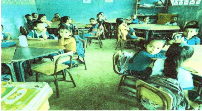
Foto 1. Módulo 1: Sustitución de piso de torta de cemento a torta de cemento, pintada de pared interior y exterior.