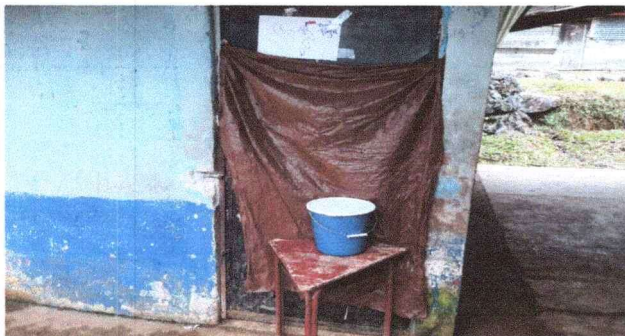
Foto 1. Módulo 1: Cambio de piso de torta de cemento a torta de cemento, pintadas de interior y exterior, cambio de estructura de madera a metal, láminas acanaladas a troqueladas.